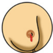
Fluido claro o con sangre que sale del pezón