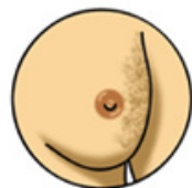
Cambios en el color o textura de la piel